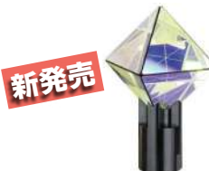
自動追尾用3Dプリズム KIRA640