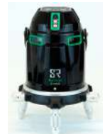
電子自動整準リアルグリーンライン レーザー墨出器 G-440SR